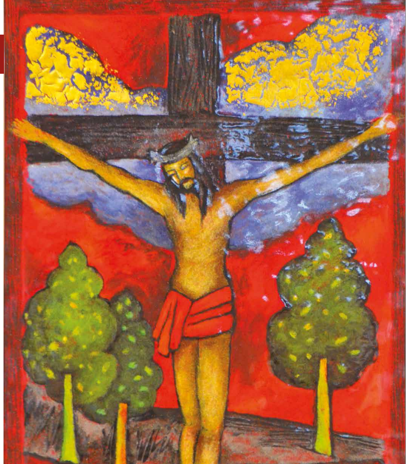
Le Chemin de Croix créé par Léa Sham's (prix de la création 2015) pour l'église Saint-Pierre à Saint-Pierre-du-Perray (Essonne) consacrée en 2016.